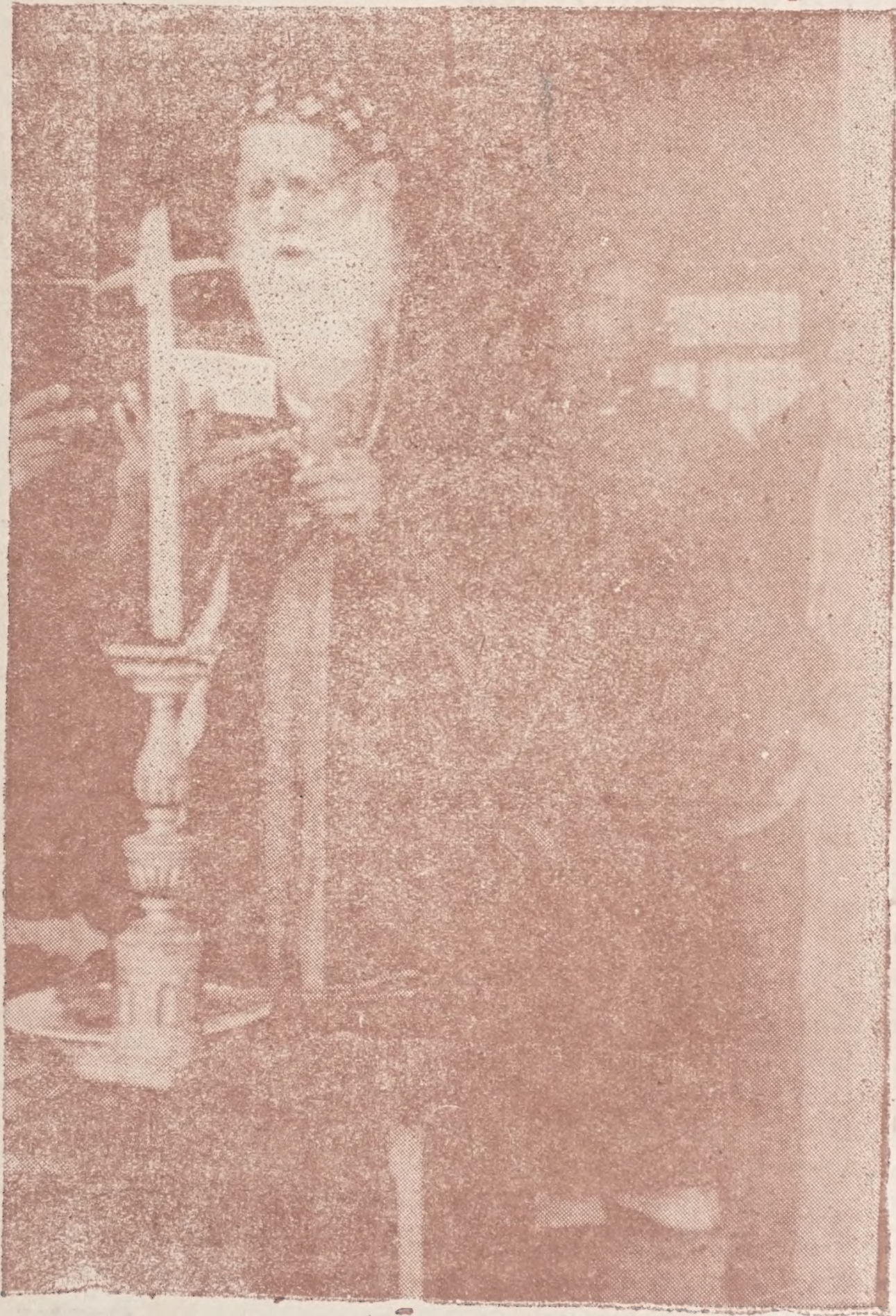
(തിരുമനസ്സിലേക്ക് ഈ ജൂൺ 16-ാം തീയതി 76 തിരുവയസ്സ് തികയുന്നു.)

സിനായ് മേഘശംഭിരമുഴക്കം-തങ്കലൊഴം താതാ! ഓഫീർതങ്കമനോഹരനെ!-ശാരോൻപരിമലർസുന്ദരനെ! ഹെർമോനിൻ പനീവിൽപൊ!-കമ്മേൽമ പൊപുന്നതനെ! വാണാറ്റം നീണാളതിമോദം!