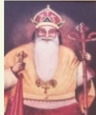
മൂന്നാം മാർത്തോമ്മായുടെ 332-30 ഓർമ്മ (ഏപ്രിൽ 22, കടമ്പനാട് കത്തീഡ്രൽ)