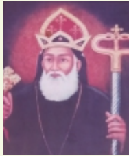
രണ്ടാം മാർത്തോമ്മായുടെ 324-30 ഓർമ്മ (ഏപ്രിൽ 14, നിരണം വലിയ പള്ളി)