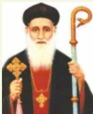
മാർ ഗ്രിഗോറിയോസ് അബ്ദൻ ജലീൽ ബാവായുടെ 349-30 ഓർമ്മ (ഏപ്രിൽ 27, വടക്കൻ പറവൂർ പള്ളി)