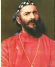
ഗിവർഗീസ് മാർ പീലക്സിനോസ് മെത്രാപ്പോലീത്തായുടെ 69-30 ഓർമ്മ (ഏപ്രിൽ 17, പുത്തൻകാവ് കത്തീഡ്രൽ)