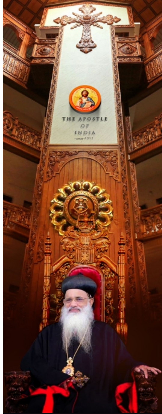
His Holiness Baselios Marthoma Paulose II The Catholicos of the East & Malankara Metropolitan The Supreme Head of the Malankara Orthodox Syrian Church of India

ആദിമ നൂറ്റാണ്ടുകളിൽ പീഡനങ്ങൾ മൂലം അടയ്ക്കപ്പെട്ട ഗുഹകളിലും ഗൃഹങ്ങളിലും രഹസ്യമായി ആരാധന നടത്തിയിരുന്ന ആദിമ ക്രൈസ്തവ സമൂഹം തളരുകയല്ല മറിച്ച് ആത്മീയമായി വളരുകയാണ് ചെയ്തത്. ആയതിനാൽ ലോക്ഡൗൺ കാലത്ത് ആരാധനാലയങ്ങളിൽ സഭാമക്കൾക്ക് ആരാധനയ്ക്ക് പങ്കെടുക്കുവാൻ കഴിയുന്നില്ലെങ്കിലും ആത്മീയ ജീവിത ജീവിതത്തിലും ജീവിത വിശുദ്ധിയിലും നമ്മുടെ ഭവനങ്ങളെ ക്രമീകരിക്കുവാൻ സാധിച്ചാൽ അത് സഭയുടെ വളർച്ചയ്ക്ക് മുഖാന്തിരമായി തീരും എന്ന് നാം ഉറച്ചു വിശ്വസിക്കുന്നു. ആത്മീയതയുടെ ആഴങ്ങളിലേക്കും വേരുകളിലേക്കും മടങ്ങിപ്പോകുവാൻ ഈ സ്ഥലം നമ്മോട് ആവശ്യപ്പെടുന്നു. ഭവനങ്ങളിൽ ആയിരിക്കുന്ന ദൈവമക്കൾ ജീവിതത്തിൽ വന്നുപോയ വീഴ്ചകളെ ഓർത്ത് പശ്ചാത്തപിച്ച് കണ്ണനീരോടെ പ്രാർത്ഥിക്കുകയും ജീവിതത്തിലെ എല്ലാ ബന്ധങ്ങളെയും വിശുദ്ധീകരിക്കുകയും ചെയ്യുമ്പോൾ ദൈവം നമ്മുടെ ദേശത്തിന് സൗഖ്യം പ്രദാനം ചെയ്യുകയും നമുക്ക് നല്ല കാലങ്ങൾ നൽകി തലമുറകളെ അനുഗ്രഹിക്കുകയും ചെയ്യും. അങ്ങനെ നമുക്ക് ഈ അടയ്ക്കപ്പെട്ട കാലത്തെ അനുഗ്രഹത്തിന്റെ കാലമായി രൂപാന്തരപ്പെടുത്താം. രക്ഷകന്റെ ഉയിർപ്പു പെരുന്നാൾ നമുക്ക് വിശുദ്ധിയും വിനയവും സമാധാനവും പുതിയ ജീവിതവും പ്രദാനം ചെയ്യട്ടെ എന്ന് നാം പ്രാർത്ഥിക്കുന്നു. ദൈവം അനുഗ്രഹിക്കട്ടെ!