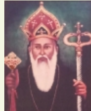
5-30 മാർത്തോമ്മായുടെ 255-30 ഓർമ്മ (മെയ് 8, നിരണം വലിയ പള്ളിയിൽ)