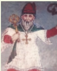
ഒന്നാം മാർത്തോമ്മായുടെ 350-30 ഓർമ്മ (ഏപ്രിൽ 25, അങ്കമാലി ചെറിയ പള്ളി)