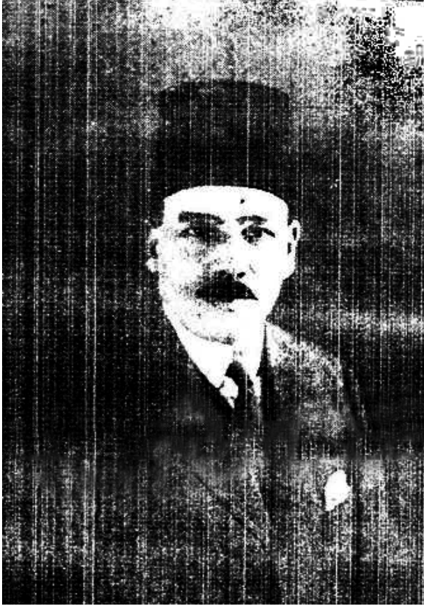
صاحب السعادة الدكتور محمد باشا شاهين – الطبيب الخاص لجلالة الملك، ووكيل وزارة الداخلية للشئون الصحية.